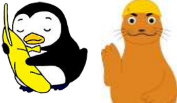
更生ペンギンのホゴちゃん ・ アシカ親方

平成 26 年に協力雇用主として登録、保護観察等対象者一人一人の境遇や能力を的確に把握され、適切な指導と熱い心でその立ち直りに努めてこられました。