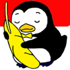
更生ペンギンのホゴちゃん