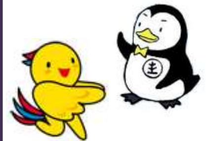
兵庫県マスコットはばタン・更生ペンギンのホゴちゃん